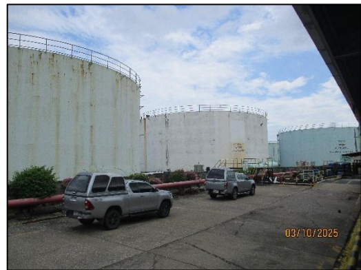
คลังน้ำมัน