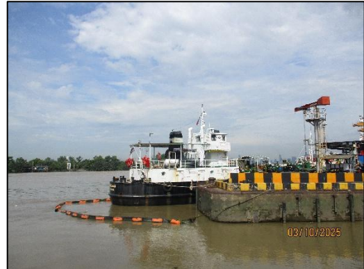
ท่าเทียบเรือ Slipway 1