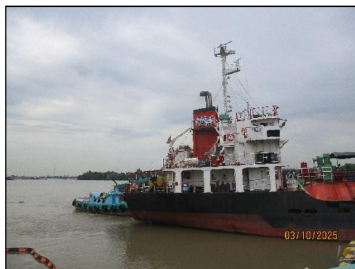
ท่าเทียบเรือ Slipway 2