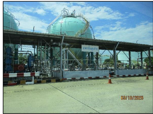
คลังก๊าซปิโตรเลียมเหลว