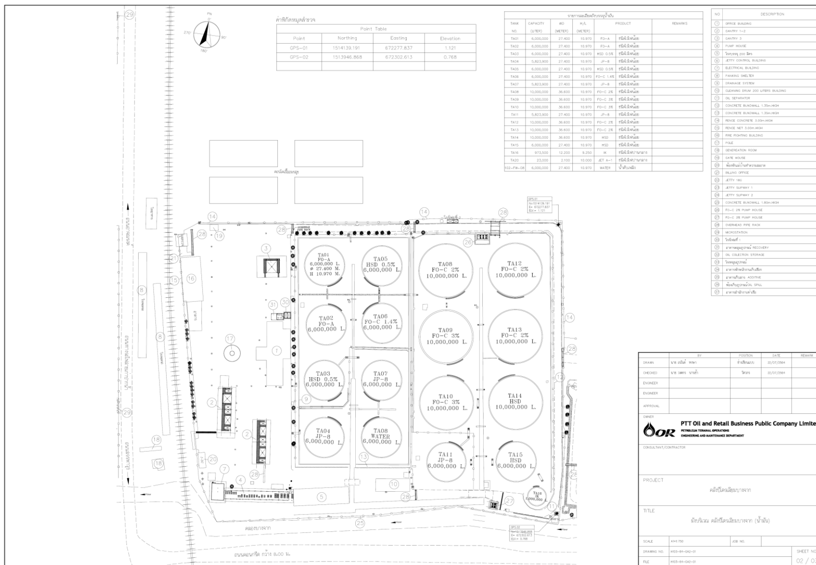
รูปที่ 1.4.2-2 รายละเอียดส่วนประกอบคลังน้ำมัน คลังปิโตรเลียมบางจาก