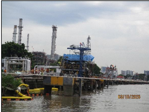
ท่าเทียบเรือ 18G